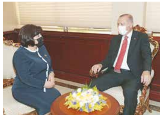
Cumhurbaşkanımız Recep Tayyip Erdoğan, Azerbaycan Milli Meclisi Başkanı Sahiba Gafarova ile görüştü.

Bu zaferin ardından yapılanlara baktığımızda çizdiğimiz tablonun nasıl ete kemiğe büründüğü görülecektir. Karabağ'ın her köşesine huzur, sükun ve umut hakim olmuştur. Evlerinden, yurtlarından ayrı olan Azerbaycanlı kardeşlerimize yuvalarına dönme yolu açılmıştır. İnşallah bir sonraki gelişimde insanların, evlerine yerleştiğini görmenin de bahtiyarlığını yaşayacağız. Onlara da şimdiden bu çağrıyı Azerbaycan Parlamentosu'ndan yapıyorum. Evleriniz yapılacak, oralara yerleşmenizi bekliyoruz. Yollar süratle yapılıyor. Viyadükler yapılıyor. Elektrik santralleri kuruluyor, açılıyor. Bunları gözlerimle gördüm, onun için söylüyorum.