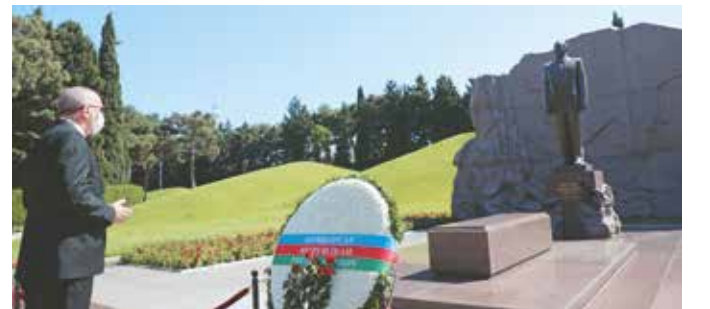
Cumhurbaşkanımız Recep Tayyip Erdoğan, Azerbaycan'ın başkenti Bakü'de merhum Cumhurbaşkanı Heydar Aliyev'in kabrini ziyaret etti.

Bahtiyarım, çünkü Karabağ'ı azad etmiş Azerbaycan'ın milli